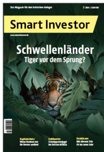
Smart Investor 2/2024

Schöfthenhuber: Die größte Gefahr bei Kontokorrentkrediten liegt bei mittelständischen Unternehmen und Handwerksbetrieben, die für ihren Geschäftsbetrieb teilweise mehrere 100.000 EUR Kontokorrent benötigen. Wenn