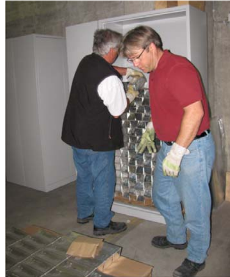
(Links: Jährliches Barrenaudit im Januar 2016; Rechts: Einlagerung von Silber Mai 2016 im Lager der Einkaufsgemeinschaft)